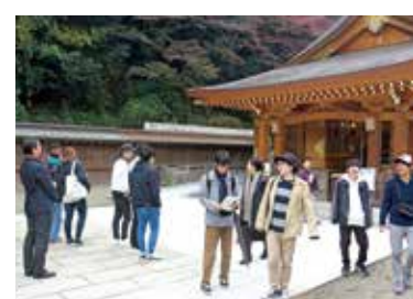
高麗神社を見学する学生たち

後期の全学部授業である「地域と大学」が行われています。城西大学にあるミュージアムのほか、近隣地域などの施設について見学、体験して具体的に学んでいます。地域の文化施設について関心を持ち、課題を発見する力を身につけるとともにグループワークを通して問題意識を深めることが狙いです。