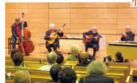
演奏するカラーカ音楽楽団

東京紀尾井町キャンパス1号棟ホールで10月6日、「文学と音楽の夕べ」が開かれました。ハンガリーの偉大な詩人、アラニュー・ヤーノシュ