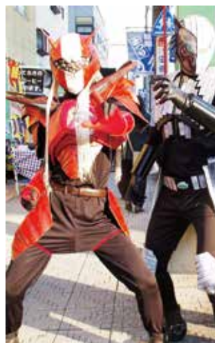
“2人のJ”(左:リベレスパーJ、右:ルーガライザーJ)

4年生による「リベレスパーJ」は、今回が実質最後のステージショー。3年生による新ヒーロー「ルーガライザーJ」は11月12日に行われた「鶴ヶ島産業まつり」で初ステージを披露しました。