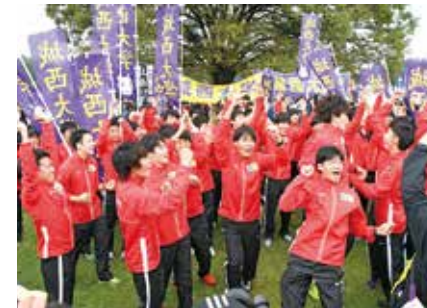
予選突破が決まり歓声をあげる選手たち

第94回東京箱根間往復大学駅伝競走（箱根駅伝）の予選会は10月14日、東京都立川市で行われ、男子駅伝部は10時間8分50秒で総合8位となり、2年ぶり14回目