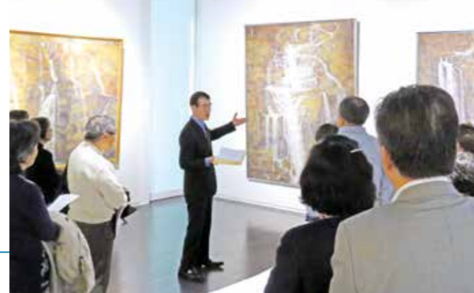
ギャラリートークの様子