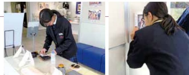
浮世絵版画の摺り体験