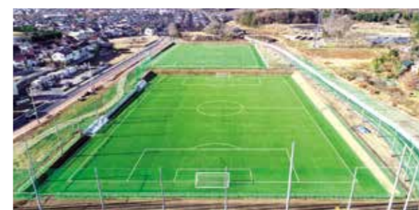
JOSAIスポーツフィールド

2021年度にサッカー部に女子チームが誕生します。少子化にもかかわらず、女子高校生のサッカー人口は増えています。毎年3月、全国の高校女子サッカーチームが参加して熊谷市で開かれている「選抜高校女子サッカー大会『めぬまカップ』in熊谷」(本年は新型コロナウイルス禍のため中止)を本学が支援していることもあり、大学でサッカーを続けたいという高校生選手の受け皿ができることとなります。今秋、サッカー場2面を擁してオープンする「JOSAIスポーツフィールド」も、チーム誕生を後押しする形となりました。