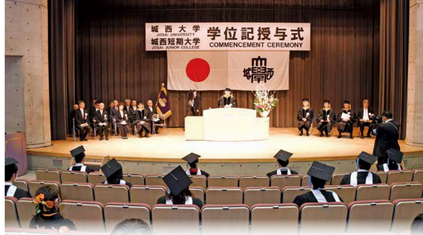
席を離し代表者による卒業式典

私も4月から城西大学に加わった新入りです。城西大学のことをいろいろ知りたく思っています。自由が戻った坂戸キャンパスや東京紀尾井町キャンパスで私を見かけたときには、是非声をかけてください。皆さんが何を学んでいるのか、何を学びたいのか、教えてほしいのです。