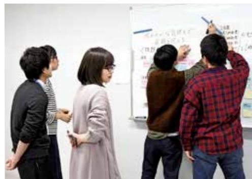
発表用プロダクトの作成

城西大学薬学部と埼玉県立大学保健医療学部、埼玉医科大学医学部、日本工業大学建築学部が1月10日、本学で多職種連携実践(IPW)演習を実施しました。4大学は「彩の国連携力育成プロジェクト(SAIPPE)」を組織し、地域住民の豊かな暮らしを支えるための専門職育成を目指した教育を行っています。今回の取り組みはその一環として行われました。