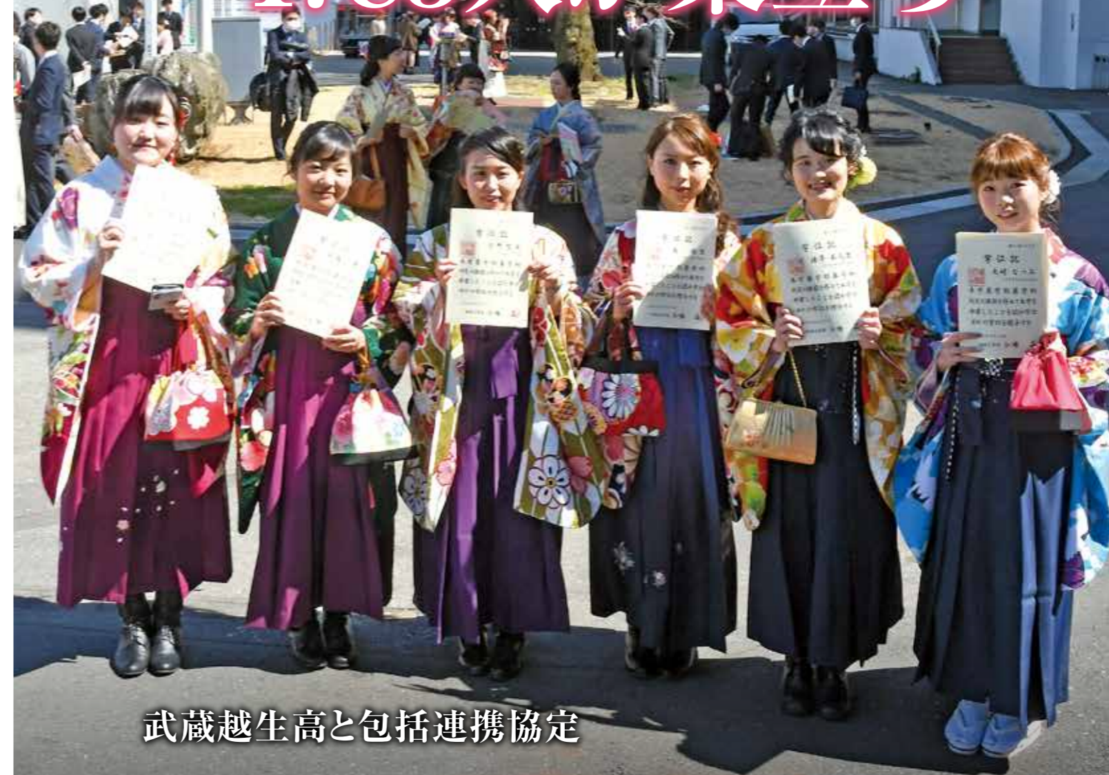
武蔵越生高と包括連携協定