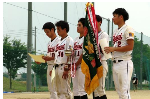
(2019.07 ホームページより 城西大学広報課)