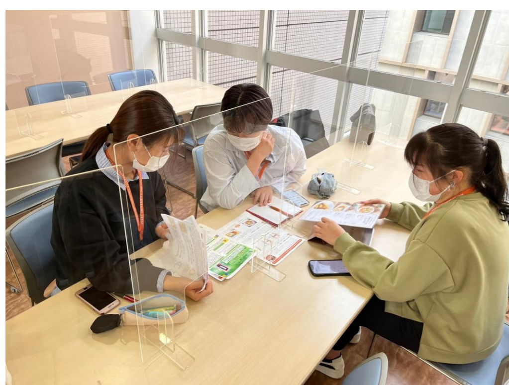
テーマ決め・メニュー考案