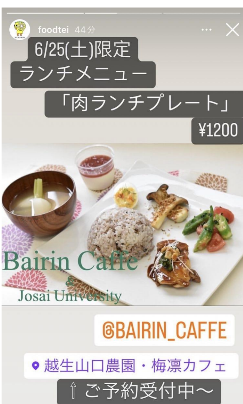
← 宣伝活動 Instagramのストーリーにて宣伝していたときの様子