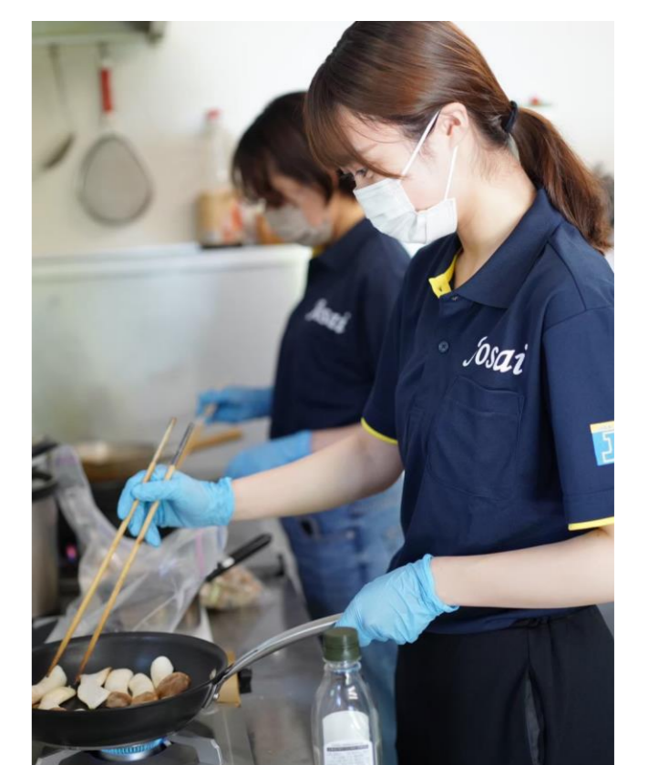
前日準備・当日の運営