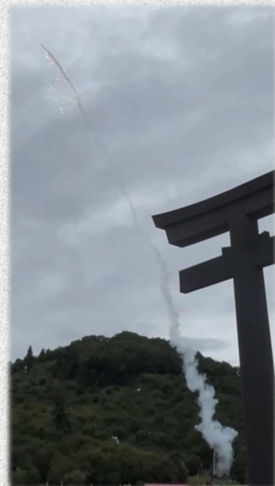
▲龍勢の打ち上げ櫓と打ち上げ