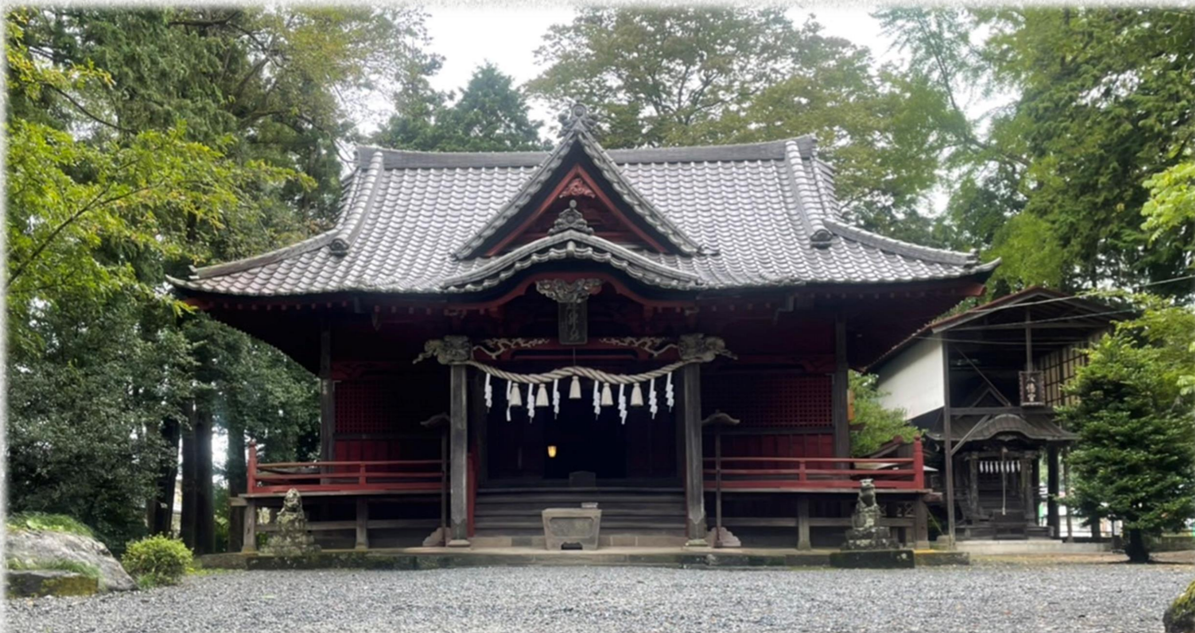
▲棕神社は龍勢の社、秩父事件で知られている