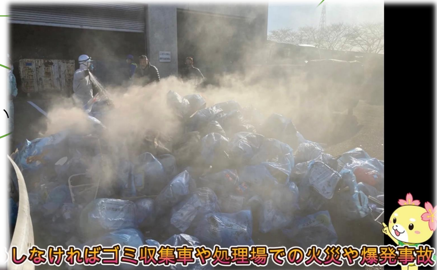
しなければごみ収集車や処理場での 火災や爆発事故