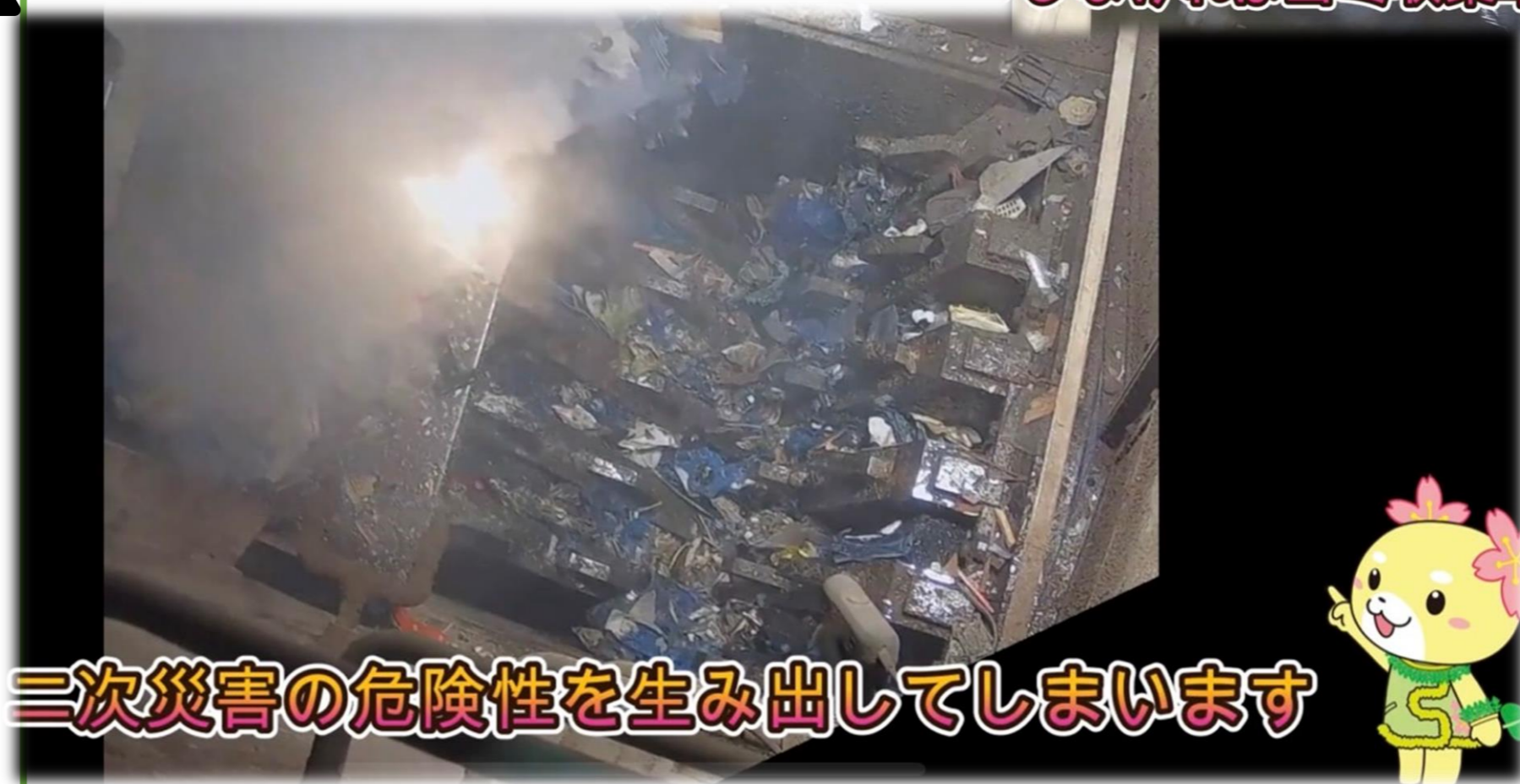
三次災害の危険性を生み出してしまいます