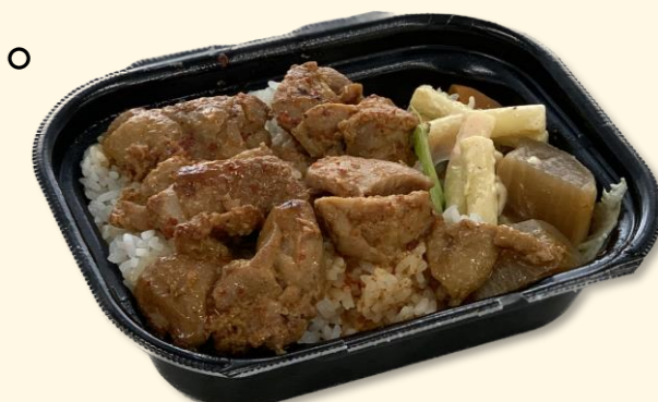
写真(上) 最高ランクのA5牛肉を使用した「A5和牛とろとろ弁当」

インバウンド客を対象にすると、宗教上の理由で食べられない肉があることもわかり、したがって鶏肉・豚肉・牛肉等の区分をわかりやすく伝える方法などについてもみんなで議論しました。