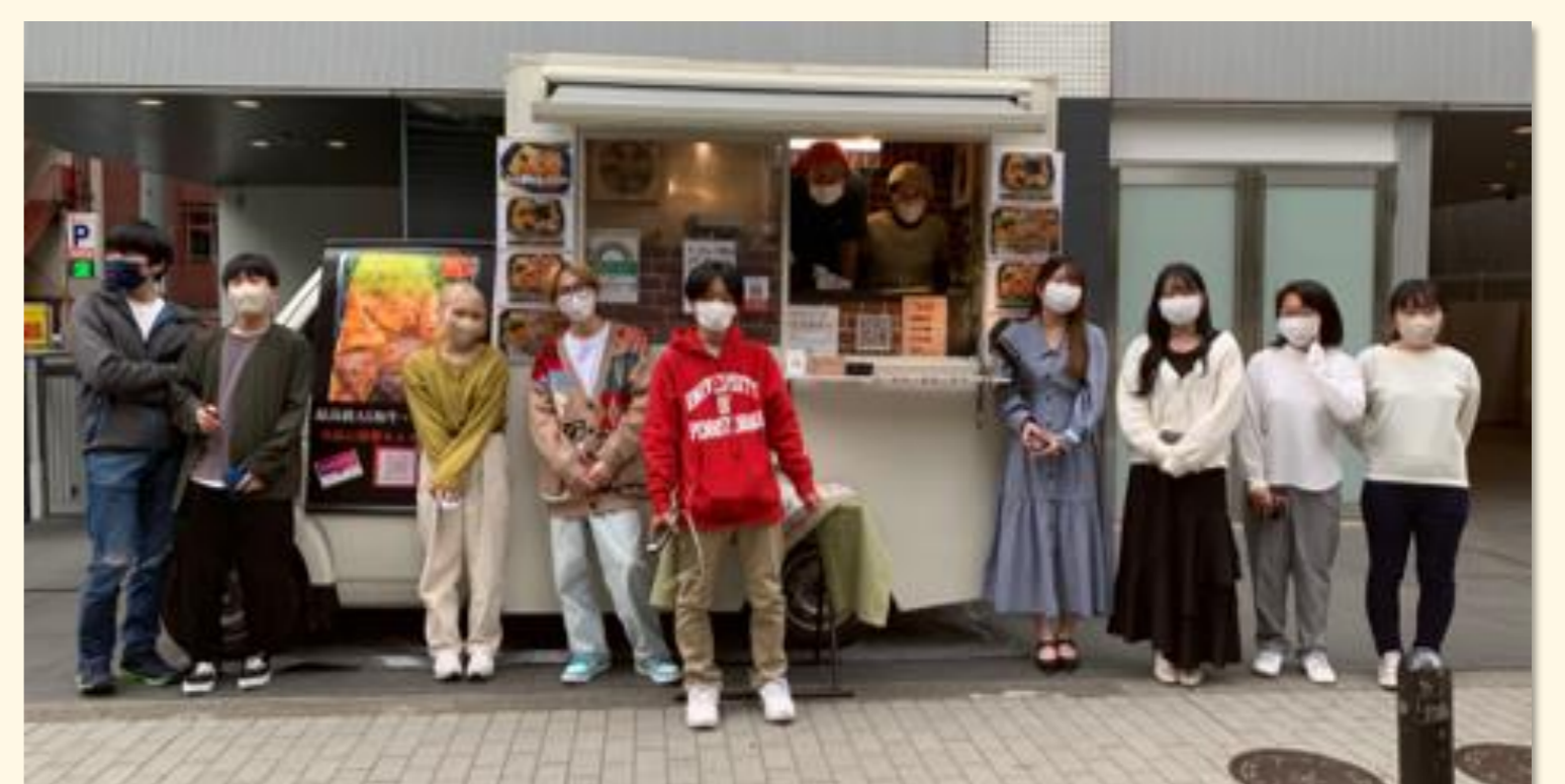
写真(上) 全員集合して記念写真を撮りました