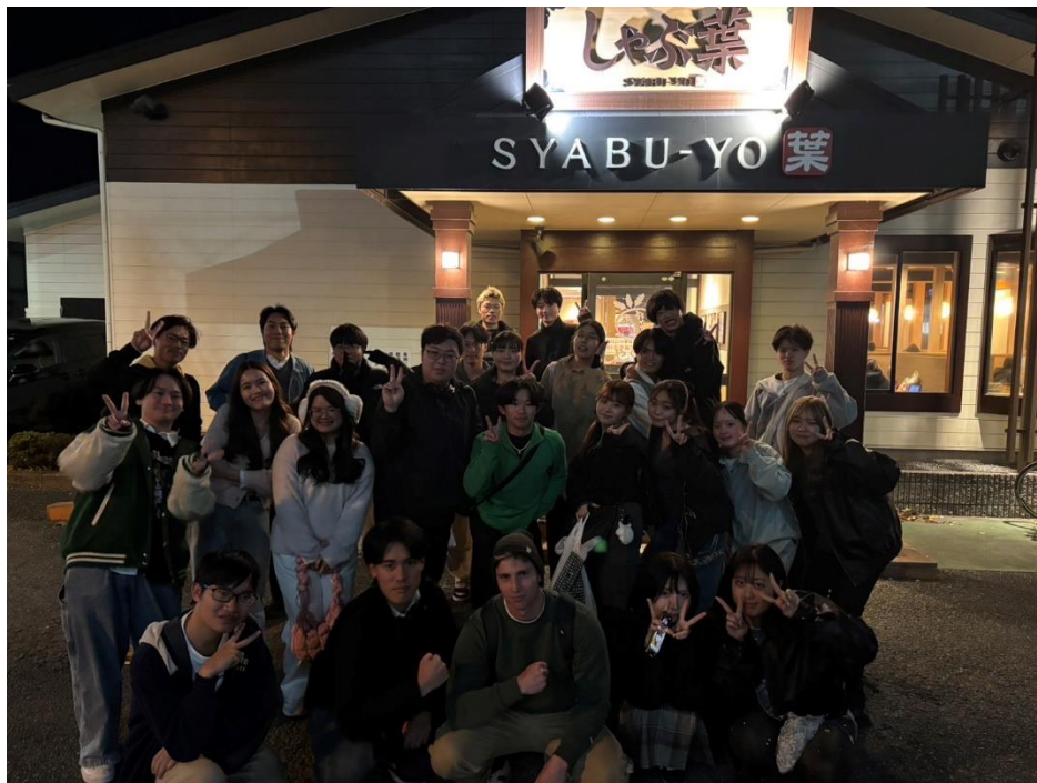
<高麗祭後の食べ会写真>

9月に日本に来てから、まず新しい環境に対して緊張を感じました。空港まで迎えに来てくださったのは先生だけでなく、留学生との交流をサポートしている JIST の学生の皆さんでした。当時の私は、初対面の人と話すことに少し不安があり、自分の日本語が十分ではないため、うまくコミュニケーションが取れないのではないかと心配していました。しかし、JIST の皆さんはとても優しく、私の拙い日本語にも丁寧に耳を傾けてくださいました。そのおかげで、次第に不安もなくなり、心を開くことができました。その後の学校活動を通して、少しずつ交流を深め、今では大切な友達となりました。これは私にとって大きな成長だと感じています。