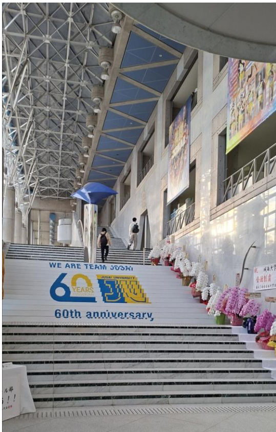
最高の大学 城西大学

私は昔から日本の文化や言語に強い興味を持っていました。大学を選ぶ際も日本へ留学できることを重視しており、城西大学への交換留学プログラムを知ったときから、ぜひここで学びたいと思っていました。