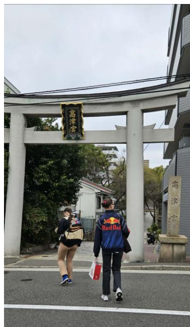
時の流れに迷い込んだ

留学生活では日本語や文化の違いに苦労しましたが、その経験を通して自立心や忍耐力を身につけることができました。また、異なる価値観を受け入れることの大切さも学びました。