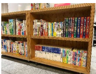
資格の本もあります

キャリアサポートセンターでは、本学学生の資質向上を目的として、在学期間中にJU キャリアラウンジの資格対策講座を受講し資格・検定取得支援奨励制度で定めた資格を取得した者に対し、奨励金を給付します。資格・検定取得支援奨励制度の資格および給付額は年度により変更となる可能性がありますので、資格講座受講申込の際にJU キャリアラウンジで確認してください。