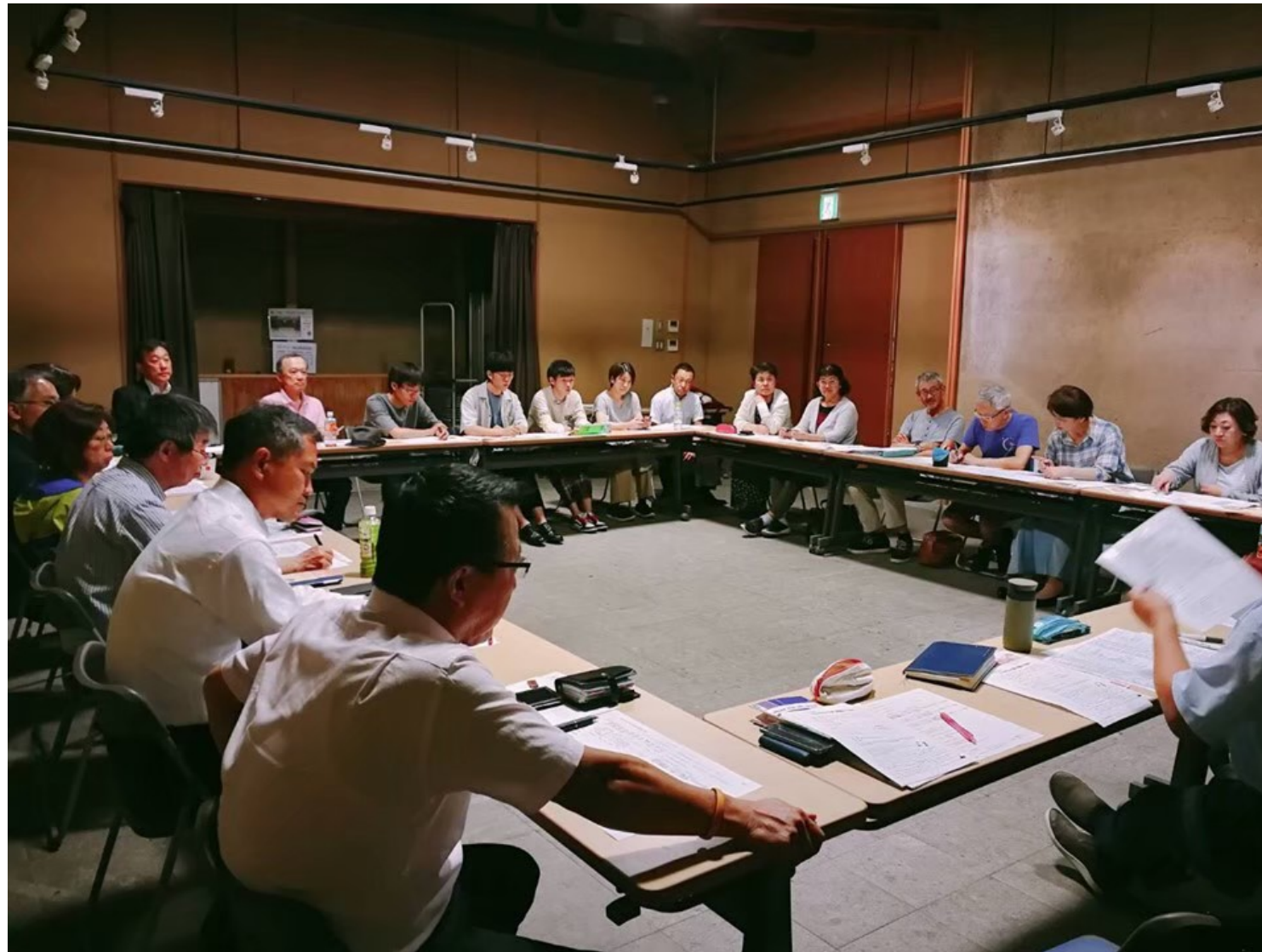
実行委員会会議の様子