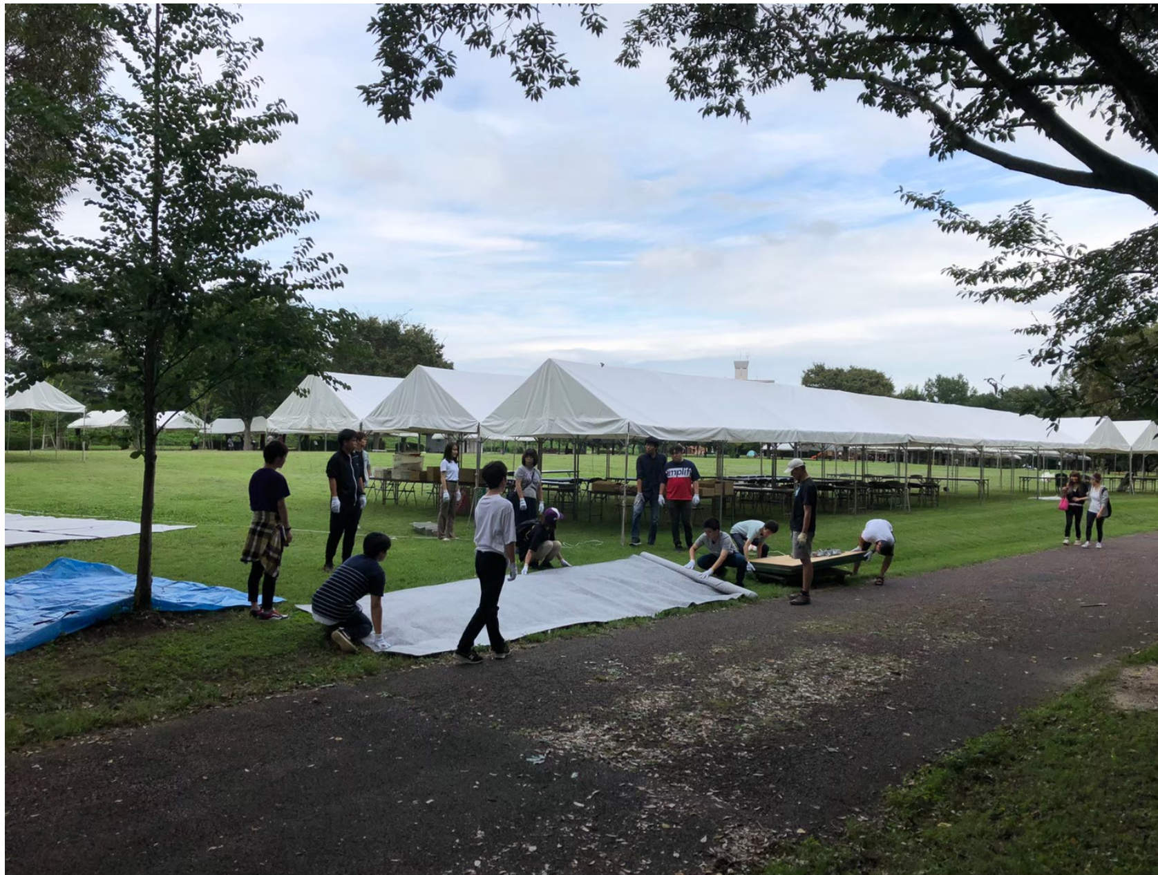
前日の会場設営・準備