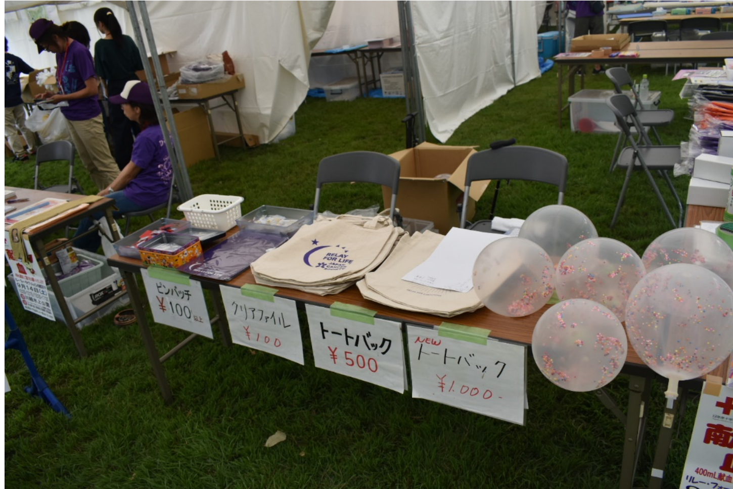
受付横のグッズ販売