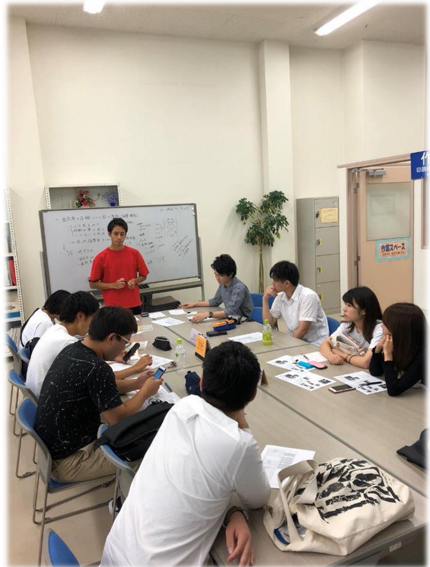
若葉にある市民活動推進センターでの打合せ(9月ごろ)→