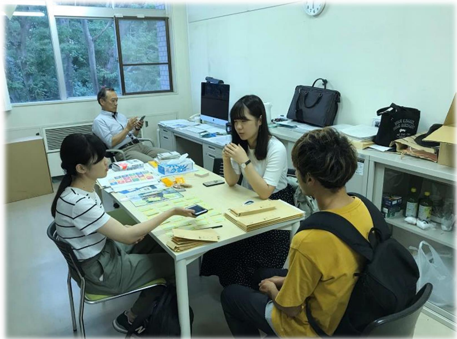
↑先生の研究室での打合せ