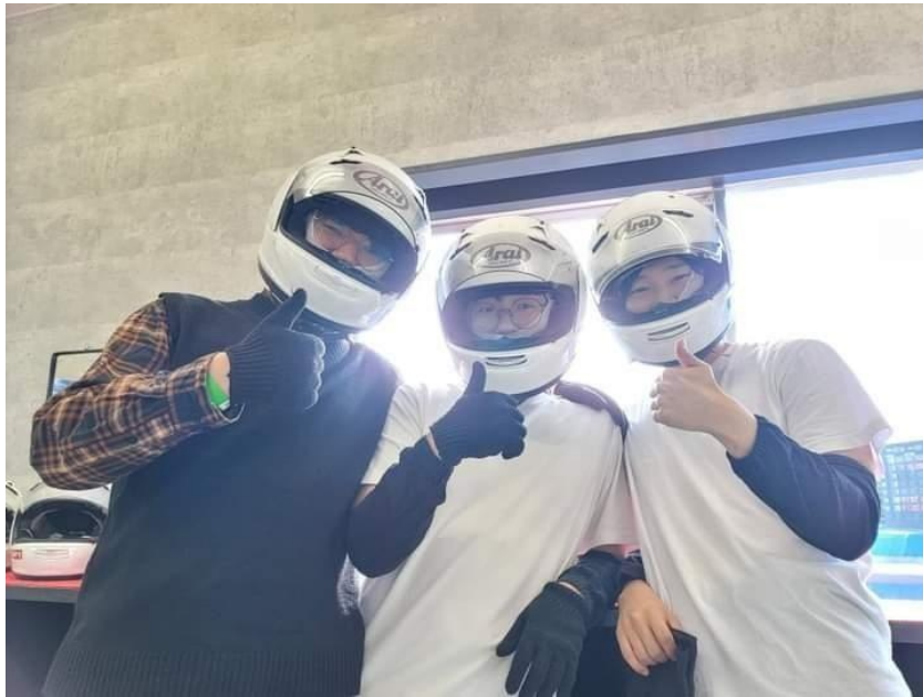
モビリティリゾートもてぎにて 記念撮影

栃木県のモビリティリゾートもてぎも本当に楽しかったです。結構遠い距離でしたが、色々な車に関するアトラクションがあって良い思い出になりました。でもその中で一番楽しかったアトラクションは、車とは全然関係ない ジップラインが一番楽しかったです。