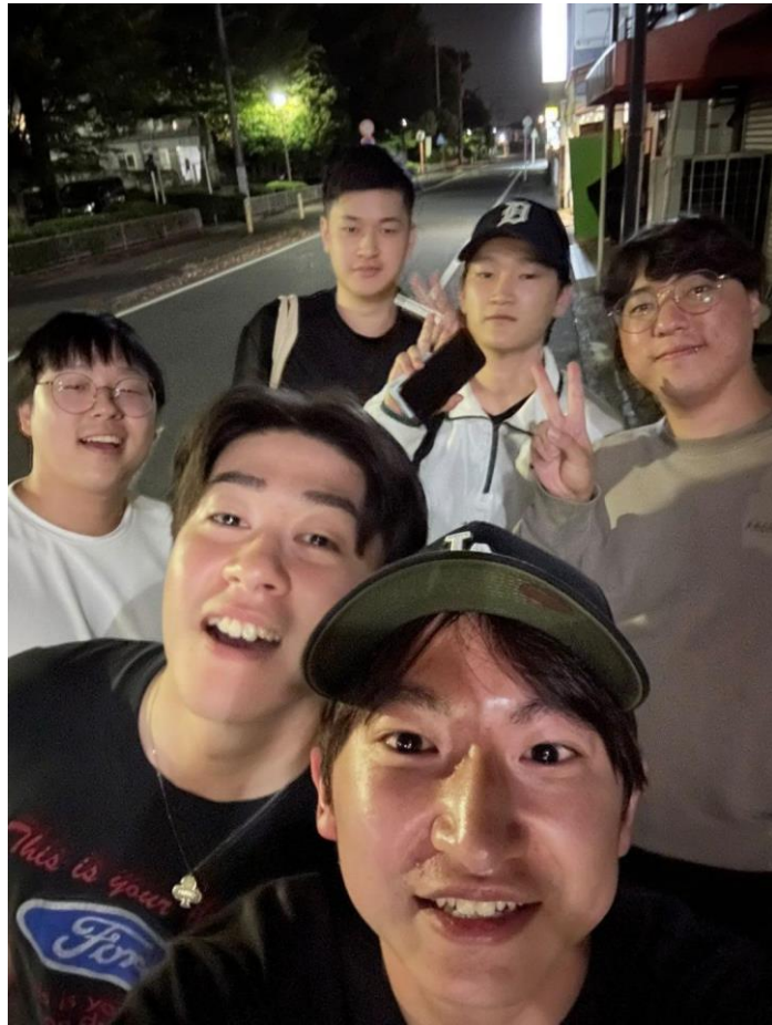
日本で出会えた友人たちと