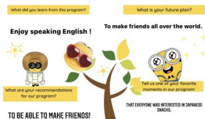
オンライン研修の様子

私がこの留学に参加しようと思ったきっかけは、同世代のベトナム人の方々と交流したり、友達になったり、大学に進学してから英語を使う機会が減ってしまっていたりしたので、この機会に沢山英語を使ってみたいと思ったからです。