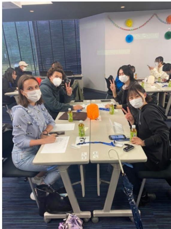
ウエルカムイベントのチームワーク中

学期の初めに選択できるクラスの数に本当に驚きました。ハンガリーの大学では日本学科で勉強していますので、城西大学では完全に新しい科目がたくさんありました。もちろん、最初に日本語の能力が心配でしたが、科目は面白くて、教授たちもいつも優しく説明してくれますので、授業で多くを学べます。選んだ科目のおかげで、この一年間日本語力も間違いなく向上できると思います。