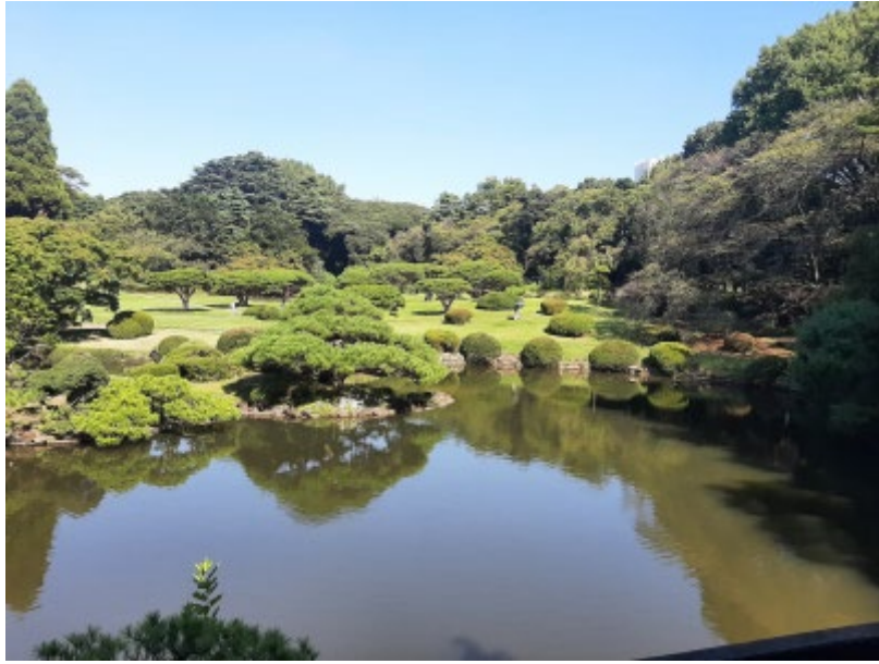
そんな稀な美しさに感銘を受けた

この2ヶ月の間に 私は授業以外に日本の有名な場所を訪れる機会もたくさんありました。