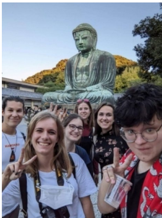
大仏と一緒にポーズしよう！

このプログラムは私の日本語力だけではなく、日本文化の理解も必ず深められますので、城西大学で過ごす一年間を楽しみにしています。残りの9ヶ月にまだ色々予定を持っていて、この機会を必ず最大限に活用したいと思います！