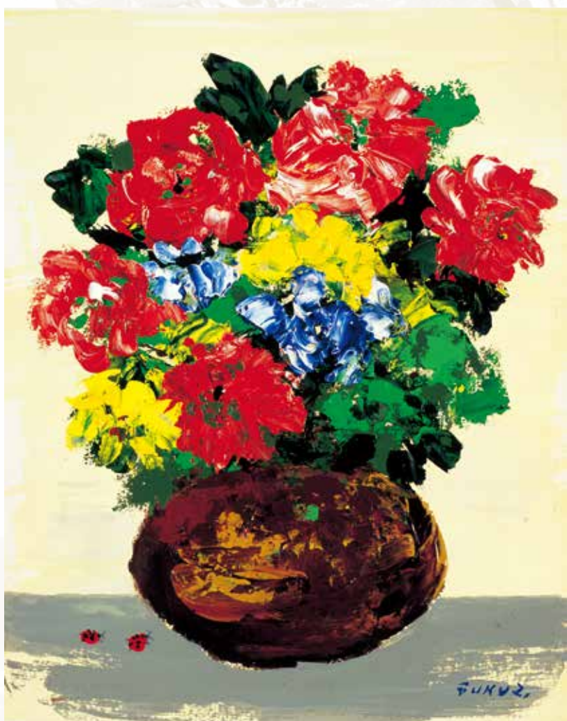
上:野口弥太郎《上海》油彩、キャンバス、45.5×53.0cm、1941年〔前期展示〕 下:福沢一郎《花とてんとう虫》アクリル、キャンバス、41.0×32.0cm、1974年〔後期展示〕