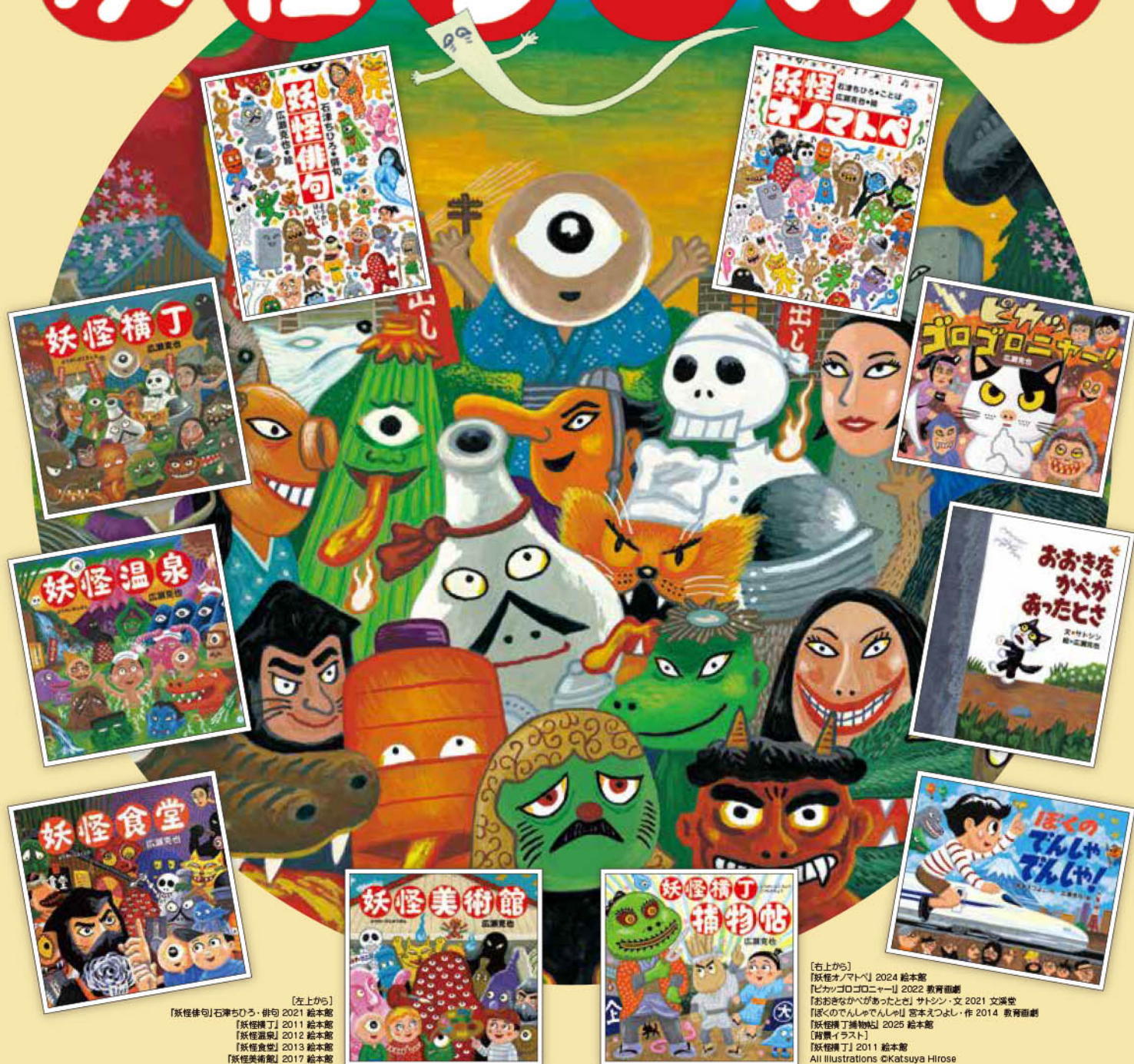
〔左上から〕 『妖怪俳句』石津ちひろ・俳句 2021 絵本館 『妖怪横丁』2011 絵本館 『妖怪温泉』2012 絵本館 『妖怪食堂』2013 絵本館 『妖怪美術館』2017 絵本館